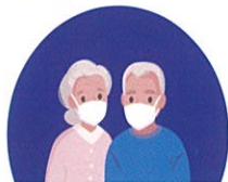
65세 이상, 일반국민 등