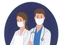
우선순위 대상기관 근무자

예방접종 대상인 경우 가까운 예방접종 기관(예방접종 센터, 위탁의료기관)에 1차 예방접종 가능 시기를 선택하여 예약 ※ 2차 예방접종은 1차 접종 완료 후 예약 가능