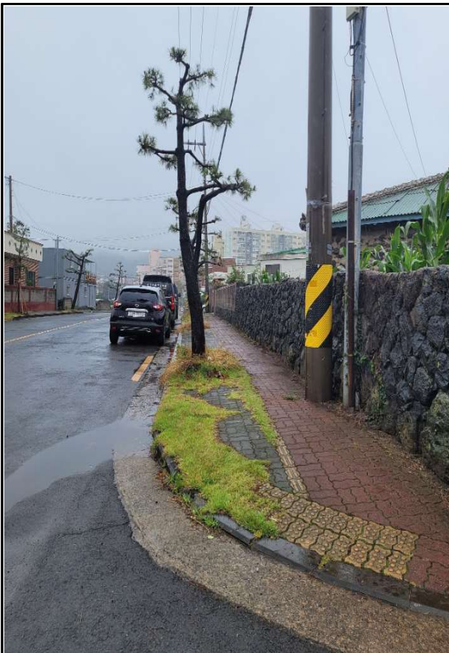
현 장 사 진