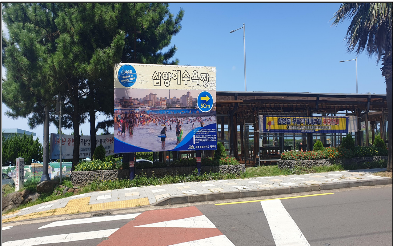
현 장 사 진