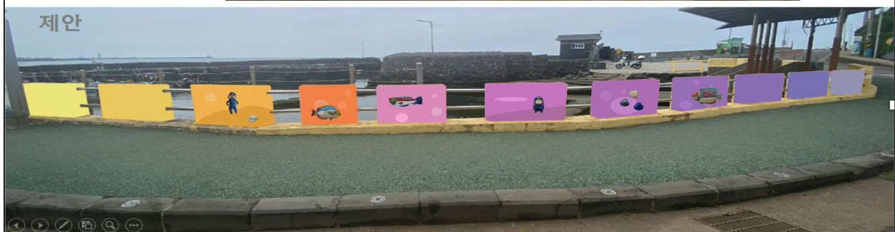
관 련 사 진(예시)