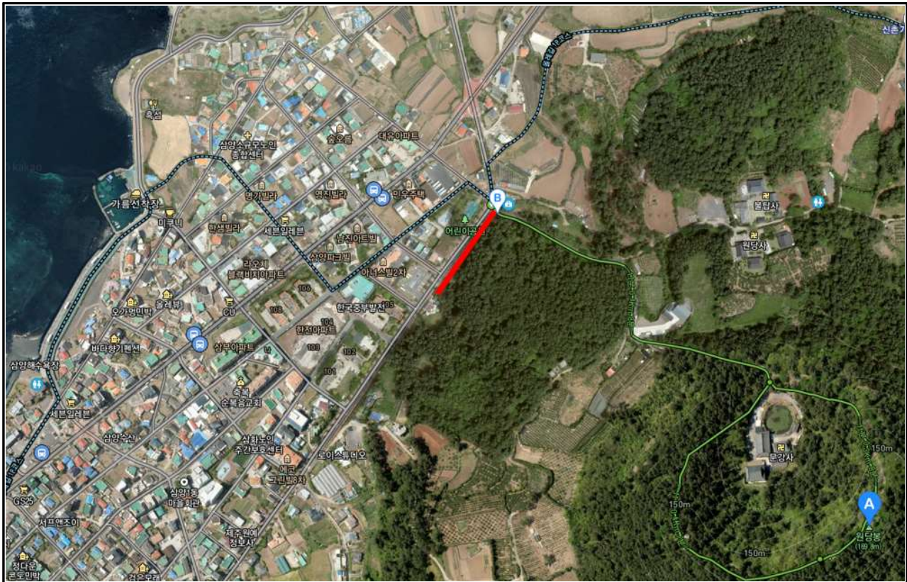
위 치 도