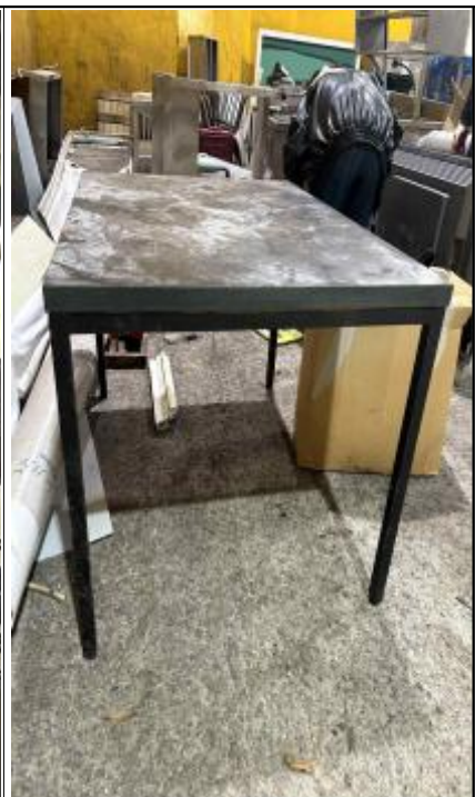
연번 :41 품목 : 4인용식탁 비고 :