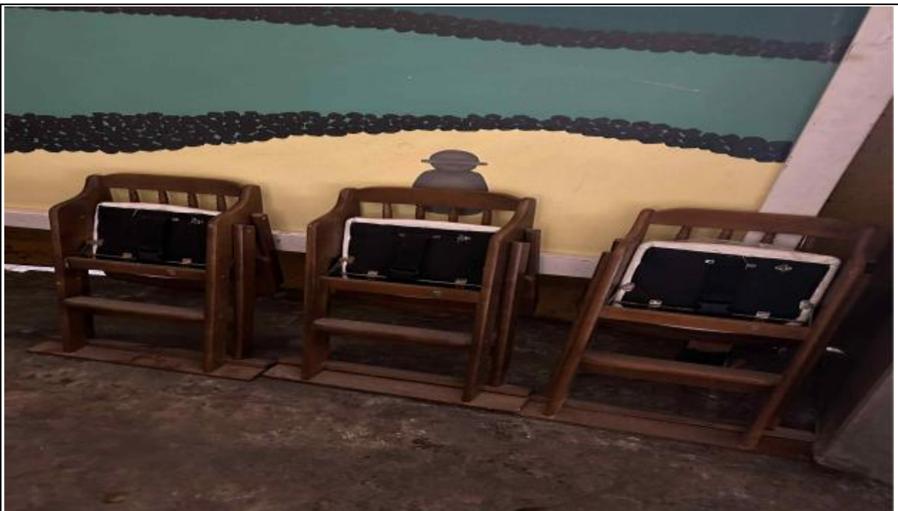
연번 :61 품목 : 유아용의자 비고 :