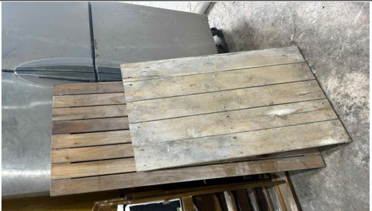
연번 :40 품목 : 발판 비고 :