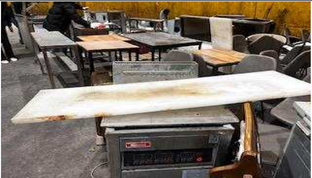
연번 :60 품목 : 도마 비고 :