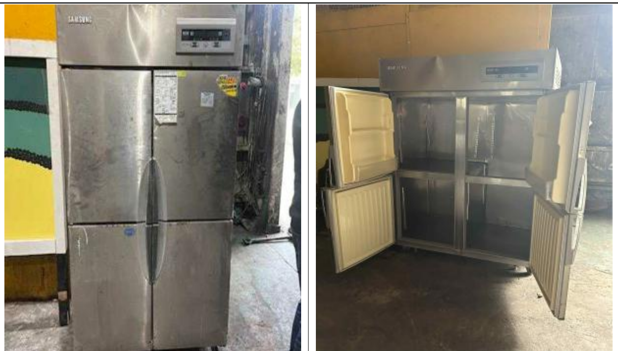
연번 :39 품목 : 냉장고 비고 :