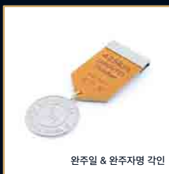
완주일 & 완주자명 각인