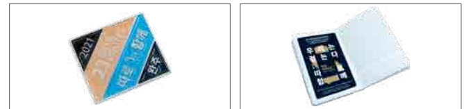
완주 인증 배지