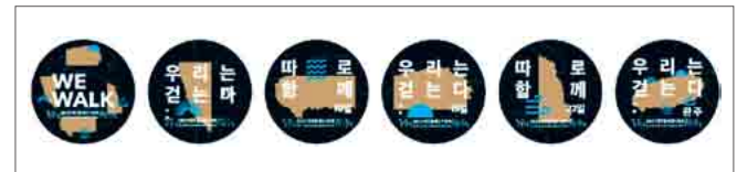
배지 (WE WALK 1종, 각 데이별 1종 총 2종 제공)