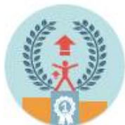
삶의 질 개선

건강위험요인이 있는 사람에게 모바일 앱을 통해 보건소 전문가 (의사, 코디네이터, 간호사, 영양사, 운동전문가)가 언제 어디서나 맞춤형 건강 상담을 제공하는 서비스입니다.