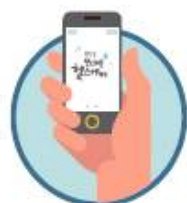
'보건소 모바일 헬스케어' 이용